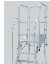
手すり取り付け例 ※実際の仕様と異なる場合があります