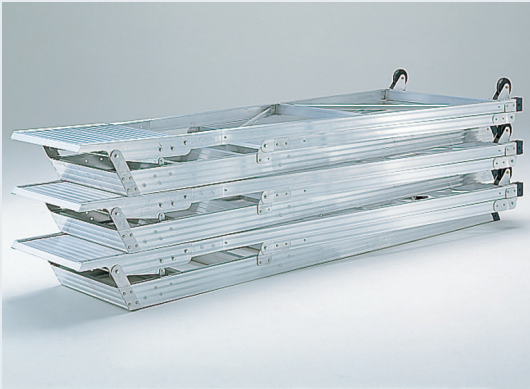
収納状態 フラットになるので収納スペースをムダにしません。 しかも、積み重ねて保管できるので何台あっても保管場所に困りません。