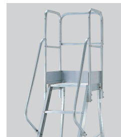
手すり取付け例 ※実際の仕様と異なる場合があります